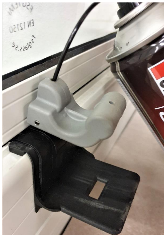
Låsmekanik dörr, vid golv.